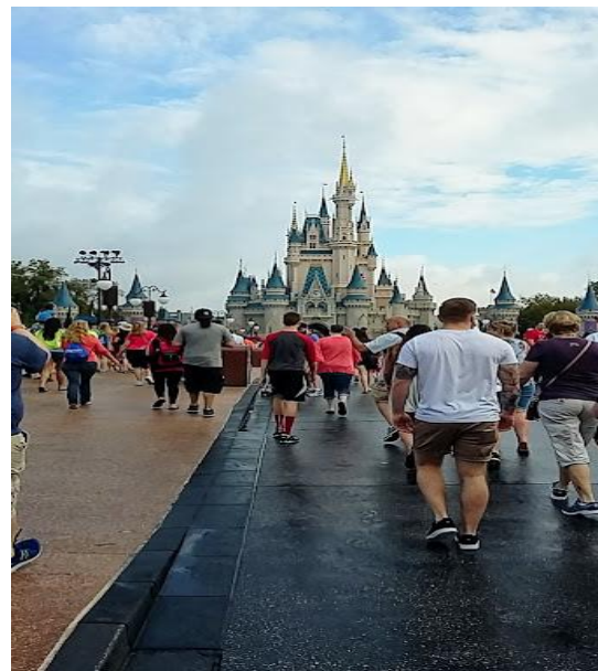
Ikonický hrad v Disney Worldu

V Disney Worldu jsme strávili tři dny, takže jsme nakonec byli rádi, že máme od myšáků a kolotočů zase pokoj. Než jsme však Floridu opustili úplně, zajeli jsme se podívat k moři! Ne všichni byli tímto neplánovaným zdržením nadšeni, ale já jsem se nemohla dočkat. Konečně jsem viděla, jak vypadá Atlantik z druhé strany! Bohužel se ale zrovna schylovalo k bouřce, a tak jsem se jen proběhla po břehu a nasbírala si pár mušlí a korálů na památku.